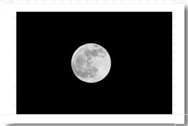
好天に恵まれ、満月がクッキリしています。