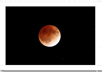
23：10 皆既月食の完成 赤みを帯びた幻想的なショーが30分続きました！