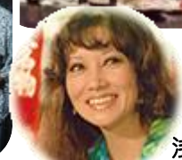
【マドンナ】 浅丘ルリ子