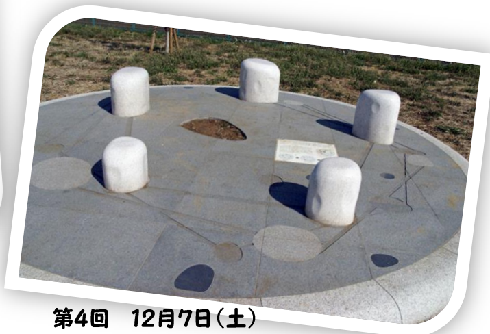
第4回 12月7日(土) 市民に親しまれる六仙公園へ