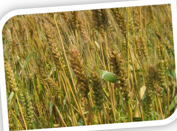
第3回 11月16日(土) 東久留米の農家の今昔