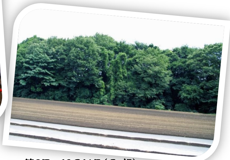
第2回 10月14日(月・祝) 向山遺跡より縄文から平安へタイムトリップ