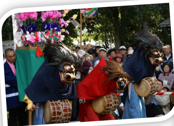
第1回 9月7日(土) 向山緑地観察と 氷川神社にて南沢獅子舞のお話

東久留米の隠れた名所の一つ、「向山緑地」と「立野川」の紹介から始まり、歴史・風土・街づくり等、さまざまな分野から東久留米を知り尽くそうという欲ばりな連続4回講座です。