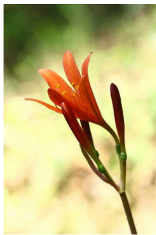
場所は、新座市営墓園の黒目川沿 斜面林にひっそりとオレンジ色の花。 いです。