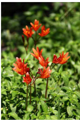
キツネノカミソリはお盆ころに咲きます。