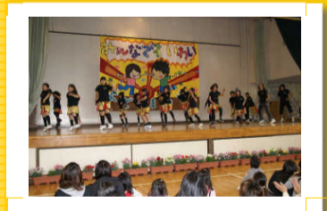
大江戸ダンス・創作ダンス

パンにおにぎり、焼きそばやソーセージなど何を買おうか迷っちゃう。お財布にもやさしい値段だから、ついつい買いすぎちゃいました。