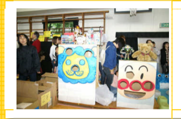
キャラクターの的当てゲーム

かわいい、保育園児によるお遊戯(^_^)会場が和みますね。こんな大観衆の前でも立派にお遊戯できました。ママたちはビデオにカメラに撮影に大忙し(笑)