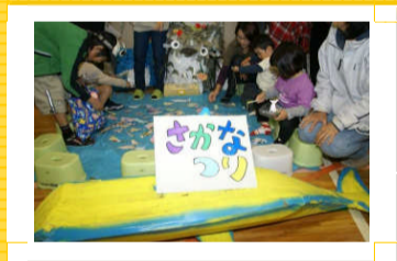
さかな釣りコーナー

室内とはいえ、抵抗があって風船が思うように飛ばない。力を入れればいれるほど、風船はふわふわ、気ままに飛んでいきます。<福祉施設このみ>