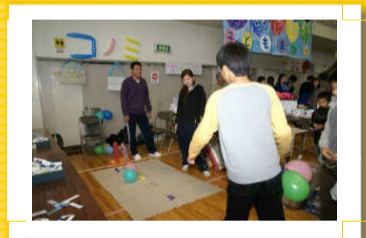
風船を投げてポイントGET！

入った個数でソースせんべいの枚数が決まるから、みんな必死。何個入ったかな？<みなみ保育園>