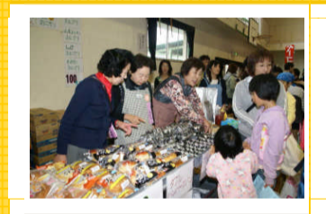
実行委員会直営店

ビニールシートの池に泳いでいる色どりの魚たち。狙った魚を釣るのは、なかなか難しい。だから夢中になっちゃうね。<ちゅうおう保育園>