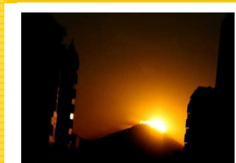
富士見テラスの定位置より。