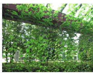
7月中旬のカーテンの様子です。 縦にばかり伸び、なかなか横に広がってくれません。 虫に食われている葉っぱが多いのも気になります。