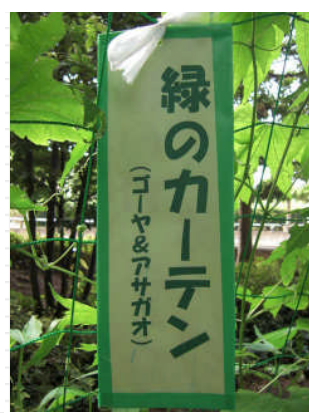
「何を育てているの？」と、時々市民の方に聞かれることがあります。 これで、何を育てているのか、何を育てているのかが一目でわかりますね。