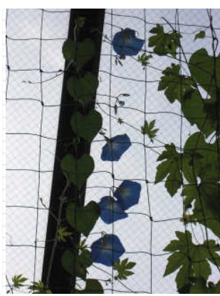
アサガオが5つ同時に並んで咲きました！ 花が咲いたり、実をつけたりすると、より植物の成長が楽しみになりますね。