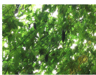
収穫した後なので、少し小ぶりのゴーヤしか残っていません。 実をつけだすと、あっという間に大きくなります。