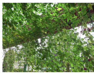
8月中旬の様子です。 側面から天井にかけての写真。 1枚目の写真と比べると、ずい分カーテンらしくなりました。 本当は隙間がないくらいにぎっしり葉が茂るのが理想です。 来年の課題ですね。