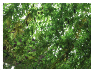
ご覧の通り、天井まで葉が伸びました。 しっかりと木陰ができています。 アサガオも、こんなに上まで伸びるんですね。