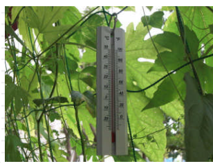
温度計を設置しました。 緑のカーテンの内側と外側では、気温が3度ぐらい変わります。