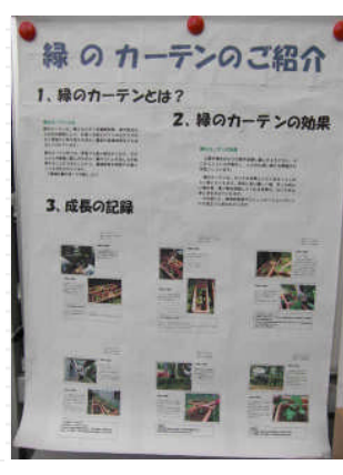
今までの記録が市役所1階屋内ひろばに展示されています。 市役所にお越しの際は、ぜひ見に来てください。 運が良ければ、収穫したてのゴーヤがあるかも・・・。