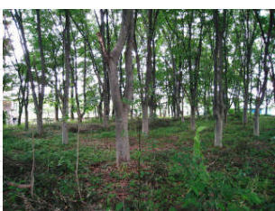
「十小みらい橋」を渡ると森林の中に入れます。

320mの短い距離でしたが、梅雨の中休みの一日、緑に囲まれて時折り吹き抜ける風が肌に心地よく感じられました。