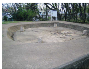
縄文時代の遺跡です。