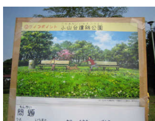
映画「河童のクウと夏休み」の一場面です。