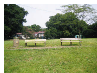
昨年の夏に写した風景です。