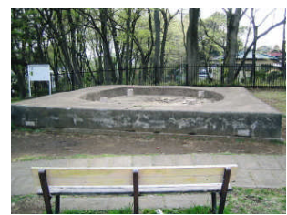
ベンチに腰かけて遺跡を見ると、何万年の昔にタイムスリップしたような気持ちになりますよ！