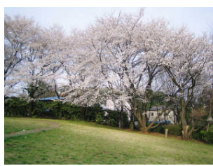
ここから東久留米市内が一望できます。