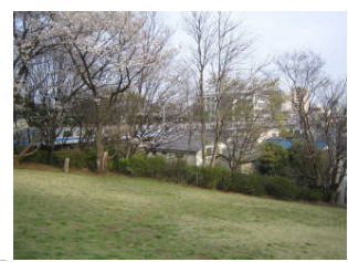
すぐ近くを西武池袋線が走っています。