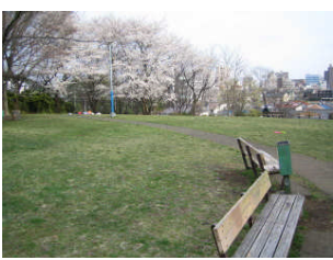
二週間ほど前に撮影したもので、桜が満開でした。