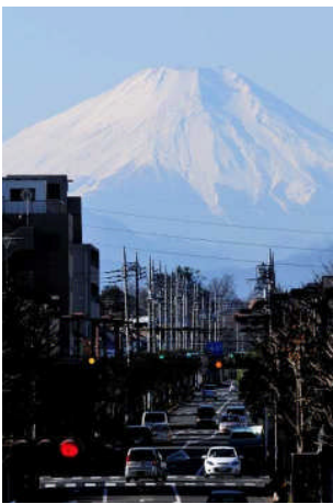
富士への道。本当に身近に感じますね。レンズのマジックかな？