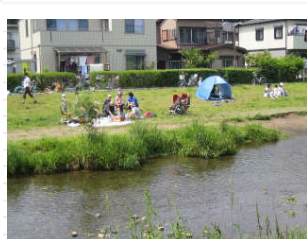
今日は日曜日で天気も良かったので「いこいの広場」は家族連れで賑っていました。