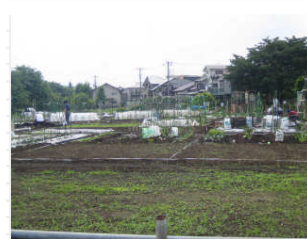
近くには「貸し農園」がありました。