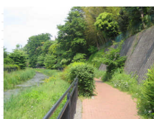
道沿いは緑が一杯、散歩にはとてもいい季節です。