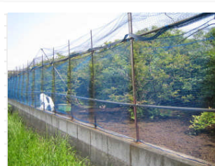
「ブルーベリー」の農園です。暑い夏が収穫の季節だそうです、いまの時期は畑の手入れで大変ですね！