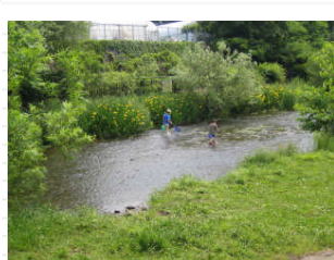
魚を獲っている親子もいました。