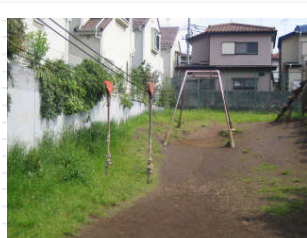
今日は誰もいませんでした。天気もいいし、子どもたちはお父さん、お母さんと一緒にお出かけかな？