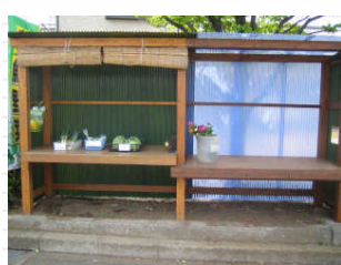
帰り道に浅間町で見かけた野菜の販売所です。これは本職の「お百姓さん」が作った野菜です。