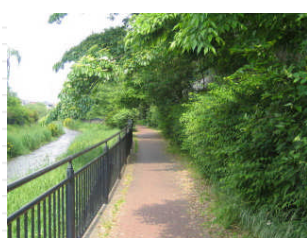
緑のトンネルのようです。気持ちがいいですね。