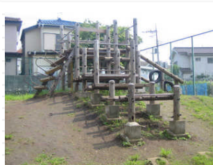
小さな遊園地ですが、遊具もありました。民家の間にある「浅間遊園」です。