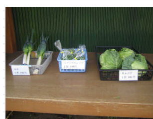
「キャベツ」が一個100円、「ネギ」も一束100円ですって、とても安いですね！安くて安全な地場産の野菜を沢山食べたいですね。