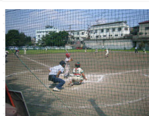
「不動橋広場」では少年野球の大会が行なわれていました。