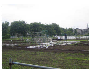
畑の手入れをしている家族連れも、見受けられました。