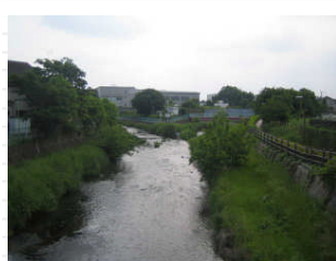
「落合川」と「黒目川」の合流地点、前方に見えるのが「スポーツセンター」です。