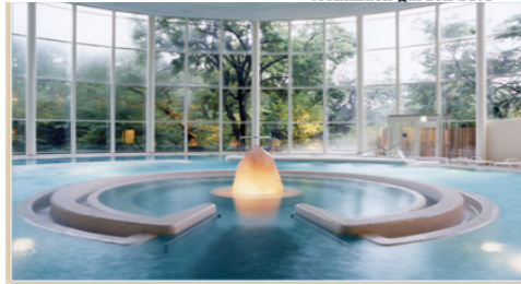
水着着用のバーデプール