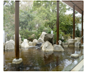
滝のある庭も散策できます