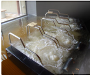
ナトリウム塩化物強塩温泉